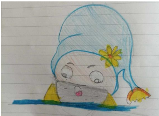
Môj kamarát trpaslík