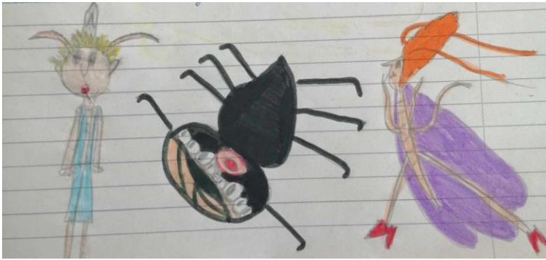
Sedem dní v pivnici