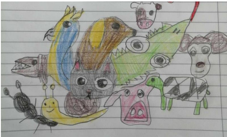
Zverinec na siedmom poschodí